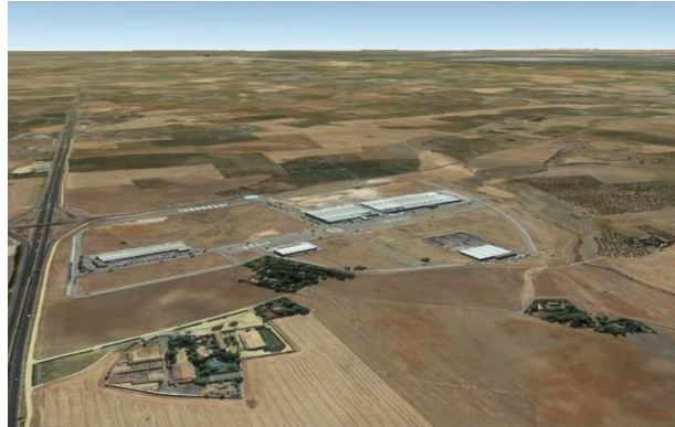
Fotomontaje. Vista de las haciendas catalogadas y de las edificaciones existentes en el Parque Logístico.

Se argumenta en la documentación presentada que las nuevas condiciones de parcela y el nuevo uso industrial-logístico va a incentivar la implantación de actividades en el parque con el correspondiente impacto positivo sobre el mercado de trabajo.